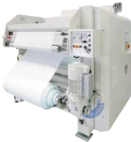
vorher: - fehlerhafte Folienaufwicklung