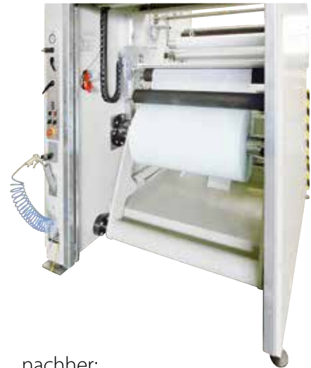
nachher: - kantengerade Aufwicklung